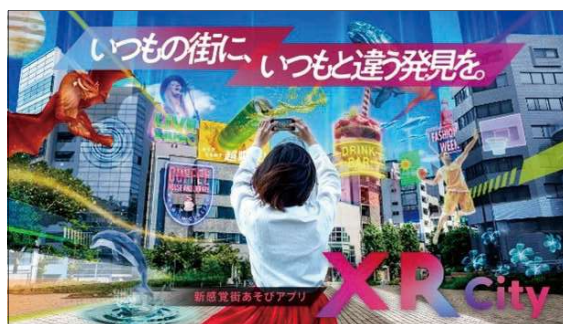
図表2-2-10 ▶ XR City