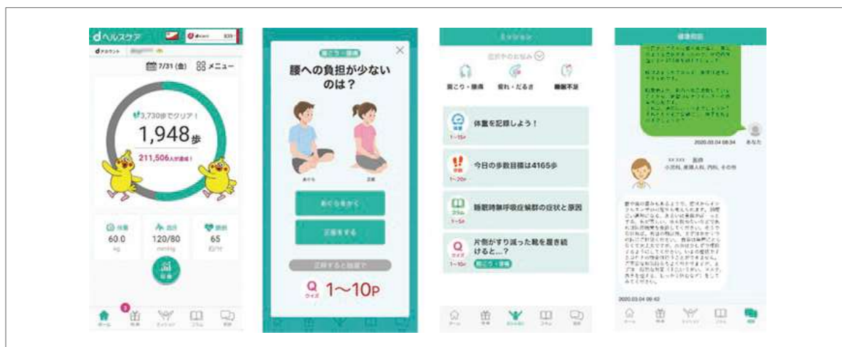
図表2-2-4 ▶「dヘルスケア」アプリ 画像イメージ